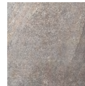
KINGS GRIS GRIP | M - 180 45 x 45 cm · 17,7" x 17,7"

SPECIAL PIECES PIEZAS ESPECIALES · PIÈCES SPÉCIALES · SONDERTEILE