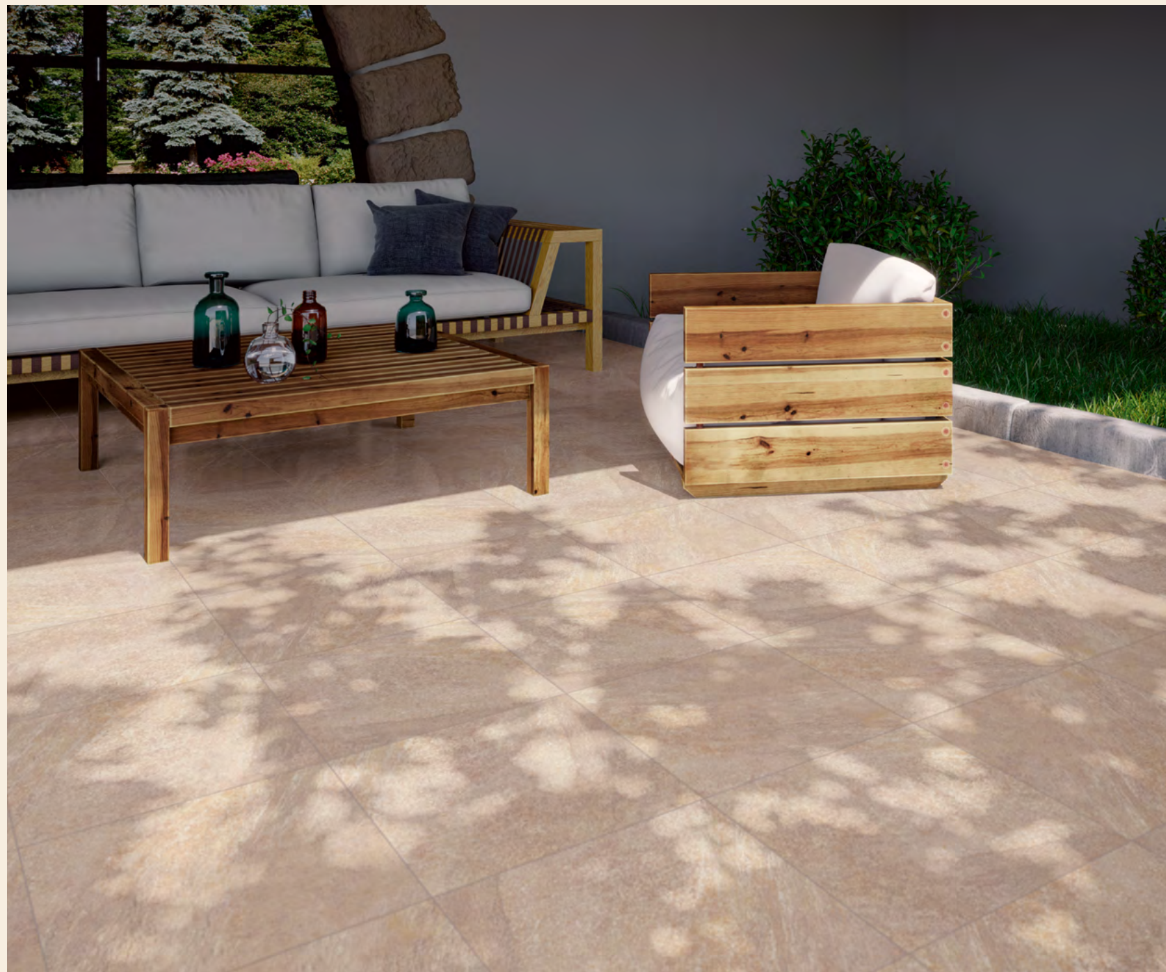
Kings Beige 45 x 45 cm Grip